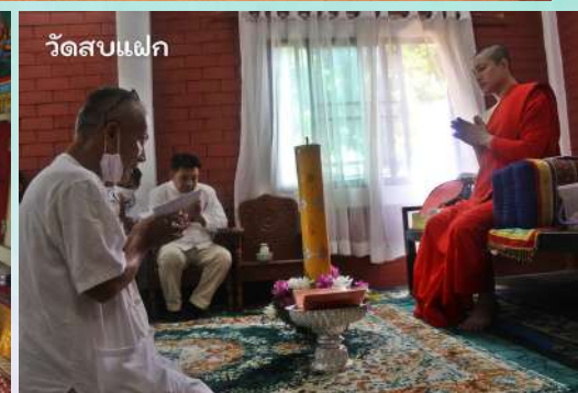
วัดสบแฝก