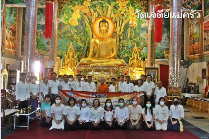
วัดเจดีย์แม่ครัว