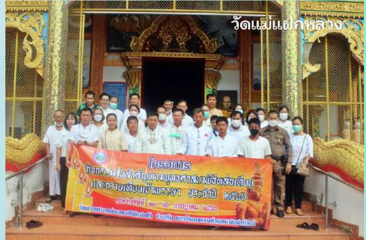
วัดแม่แฝกหลวง