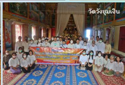
วัดวังขุมเงิน