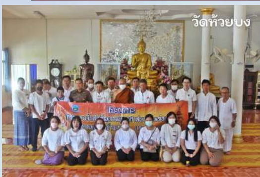
วัดห้วยบง