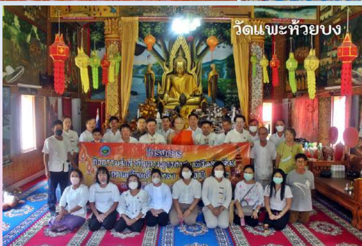
วัดแพะห้วยบง