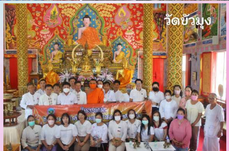
วัดบัวมุง